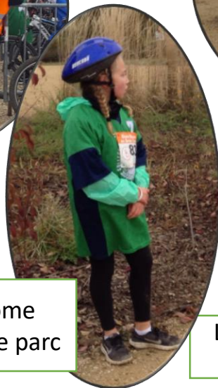
L'attente de son binôme avant de rentrer dans le parc