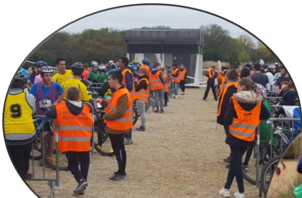
Le parc : la sortie, le casque ...