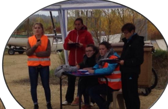
Les tours et temps de passage