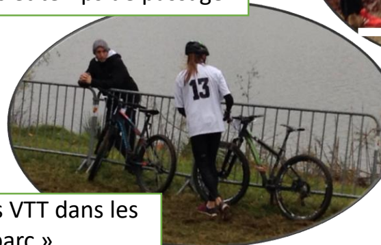
La dépose des VTT dans les « tri parc »