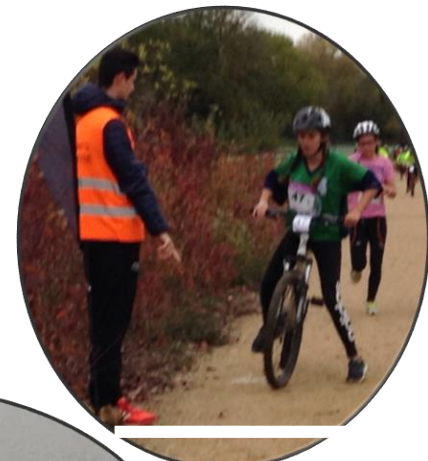
La descente du VTT avant le passage de la ligne